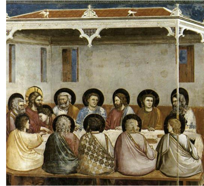
Giotto : La cène